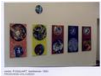
centre pasquart bienne 1993