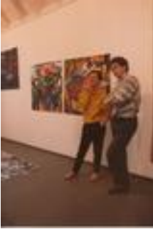
kunstmuseum cantone di turgovia 1984