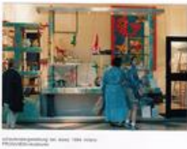
alessi milano 1995