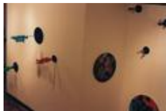
berner galerie 1995