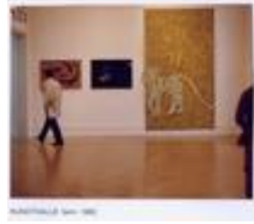
kunsthalle berna 1982