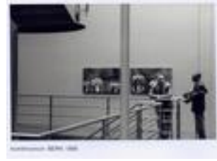
kunstmuseum berna 1988