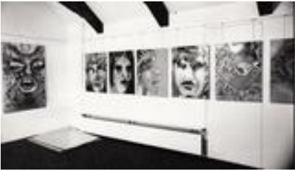
aktionsgalerie berna spray art 1978